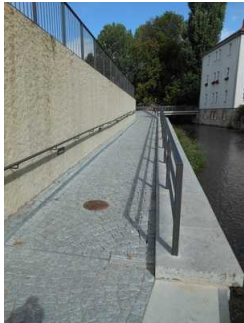
Rampenweg zur Mikwe

Über die Rampe sind zu erreichen: Eingangsbereich , Wege außen zum Plateau mit Schaufenster und Treppe zur Mikwe