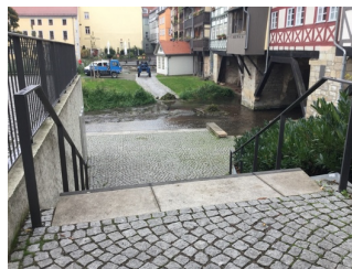
Weg mit Stufen zur Mikwe

Über die Schwelle / Stufe / Treppe sind zu erreichen: Eingangsbereich